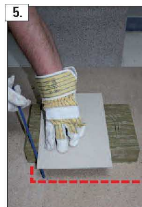
5. Col supporto della sagoma e utilizzando la lama in dotazione procedete a tagliare a misura il pannello – il listello in eccesso da un lato va posizionato al lato opposto per ripristinare l'altezza totale del pannello (h = 33 cm come la camicia)!