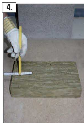
Riportate le misure rilevate sul lato lungo del pannello