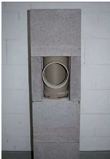
Vista dell'allacciamento a 90° già predisposto (vd. istruzioni specifiche)

Attenzione: lo stacco dell'allacciamento e tutte le superfici di posa devono essere pulite e libere da polveri e detriti