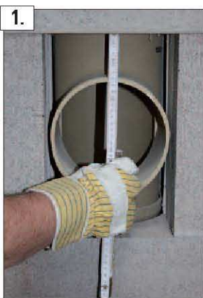
1. Prendete le misure al di sotto e al di sopra dello stacco dell'allacciamento rispetto al filo della camicia