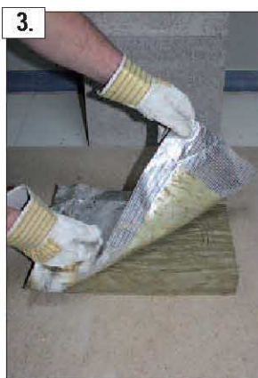
3. Rimuovete con cura il rivestimento in foglio alluminato – attenzione a non danneggiarlo!