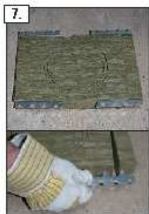
7. Fissare i 4 ganci apposti ai lati del pannello