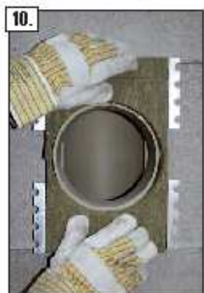
10. Spingere il pannello e i ganci di fissaggio all'interno della camicia, con l'aiuto della sagoma di taglio inserite a filo dell'imboccatura dell'allacciamento.