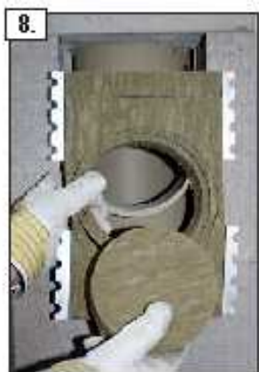
8. Rimuovete le membrane estraibili dal pannello secondo il diametro di riferimento della derivazione dell'allacciamento